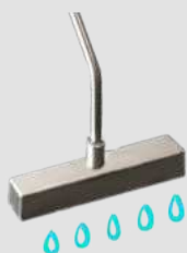
Heißwasser-Lanze 20 cm

Durch die Arbeitsbreite von 20 cm lassen sich auch schwer zugängliche Bereiche gezielt mit heißem Wasser behandeln.